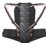
脊柱プロテクション