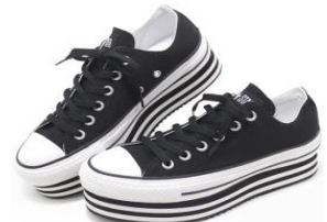
レーシングシューズ/スニーカー