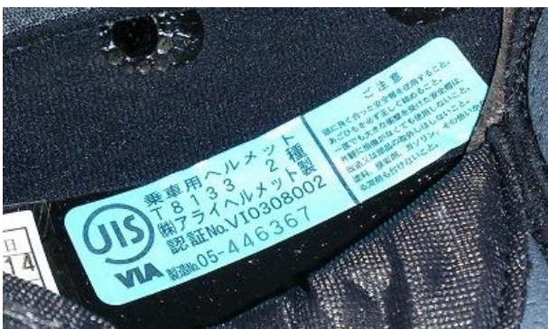
JIS 規格 2 種表示

上記規格の内、何れかに該当するヘルメットを使用してください。 上記規格外のヘルメットは使用できません。